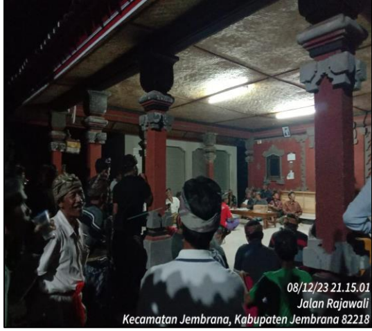
08/12/23 21.15.01 Jalan Rajawali Kecamatan Jembrana, Kabupaten Jembrana 82218

Pada hari Jumat tanggal 8 Desember 2023 pukul 20.45 s.d 22.25 Wita bertempat di Balai Banjar Adat Sawe Mundukwaru, Kel. Dauhwaru, Kec. Jembrana, Kab. Jembrana telah dilaksanakan kegiatan Pemilihan Kelian Adat Banjar Sawe Mundukwaru, KelDauhawaru, Kec. Jembrana, Kab. Jembrana.