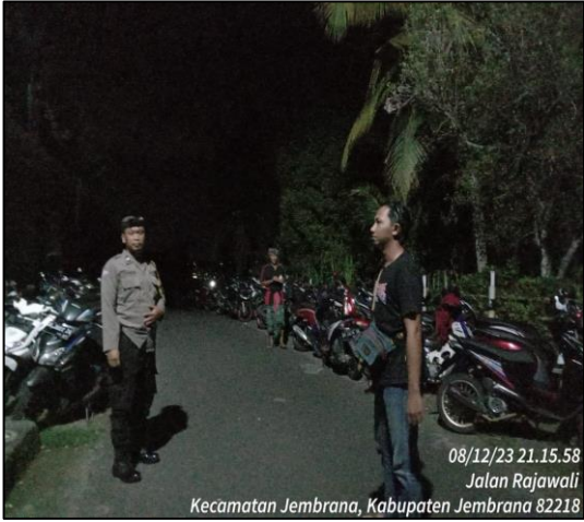
08/12/23 21.15.58 Jalan Rajawali Kecamatan Jembrana, Kabupaten Jembrana 82218