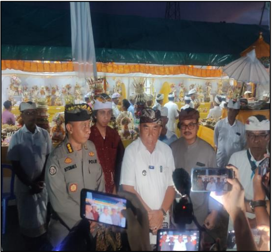
Pada hari ini Rabu tanggal 31 Januari 2024 sekira pukul 17.00 wita s/d pukul 20.10 wita bertempat diareal Museum Purbakala Gilimanuk sedang berlangsung kegiatan Ngaben Kolektif Kusa Pranawa Kec. Melaya yang dipusatkan pelaksanaannya di Kel. Gilimanuk,