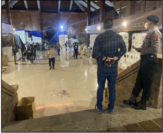
Pada hari Rabu tanggal 31 Januari 2024 pukul 08.00 wita s.d selesai bertempat di Gudang Penyimpanan Logistik KPU Kab. Jembrana ( Gedung Auditorium ) Jln. Mayor Sugiyanyar 1 Kel. Pendem, Kec/Kab. Jembrana telah dilaksanakan Kegiatan Setting Logistik Pemilu Tahun 2024.