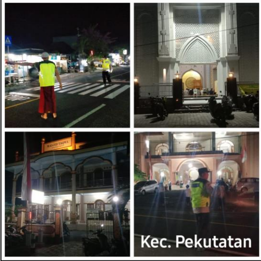
Selamat malam Komandan, mohon ijin melaporkan pelaksanaan Sholat Tarawih dalam rangka Bulan Suci Ramadhan 1445 H di masing - masing Masjid/Mushola se-Kab. Jembrana pada hari Minggu tanggal 31 Maret 2024, mulai pukul 19.30 s.d 21.30 Wita.