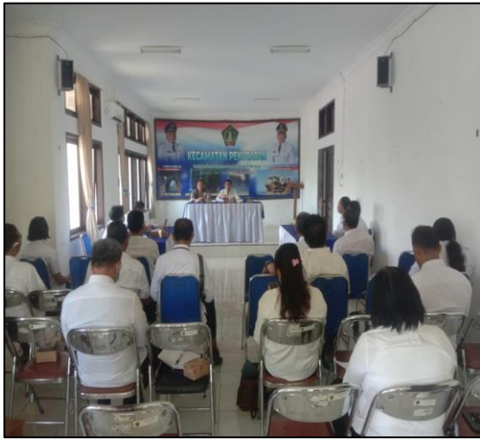
Pada hari Rabu tanggal 5 Juni 2024 pukul 09.30 WITA, bertempat di Aula Kantor Camat Pekutatan, Br. Pasar, Desa/Kec. Pekutatan, Kab. Jembrana, telah berlangsung kegiatan rapat Koordinasi lintas Sektoral Kec. Pekutatan.