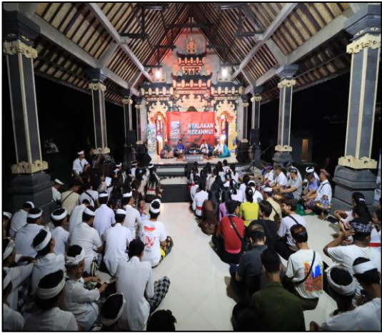
Pada hari Rabu tanggal 05 Juni 2024, mulai Pkl 17.00 wita bertempat di Balai Banjar Adat Nusasari, Ds. Nusasari, Kec. Melaya, Kab. Jembrana telah dilaksanakan kegiatan megendu wirasa bertajuk 'Megekah Jah' dalam rangka memperingati Bulan Bung Karno dan mempererat tali persaudaraan antar Sekaa Truna Truni dan Sosialisasi Program - program oleh Pasikian Yowana MDA Kab. Jembrana.