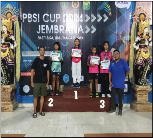
Pada hari Jumat, tanggal 14 Juni 2024 pukul 15.00Wita s/d 23.20 Wita bertempat di Gedung PBSI Kab. Jembrana, Kel. Pendem, Kec/Kab. Jembrana telah dilaksanakan kegiatan Babak Final Turnamen Badminton PBSI Cup 2024.