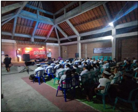
Pada hari Jumat tgl 14 Juni 2024, pkl 19.00 wita,bertempat di Wantilan Desa Adat Asahduren, Pekutatan telah berlangsung kegiatan Megendu Wirasa dengan tajuk "Me gesah Jah" dalam rangka memperingati Bulan Bung Karno.