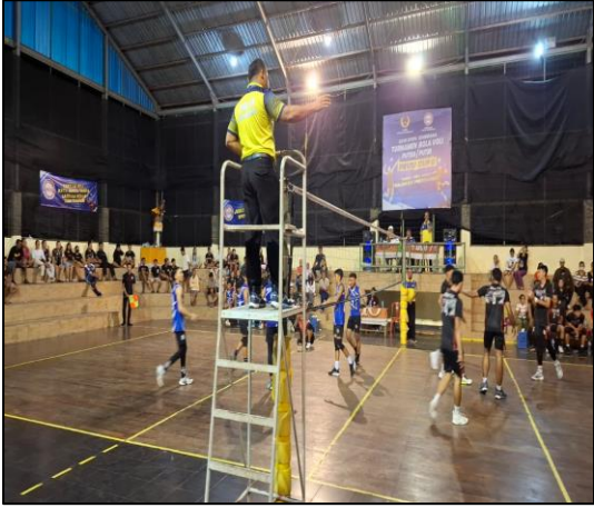
Pada hari Jumat tanggal 14 Juni 2024, mulai pukul 20.00 wita, bertempat di GOR Taruna Jaya Ds. Mendoyo Dangin Tukad, Kec. Mendoyo, Kab. Jembrana, telah berlangsung babak 8 besar turnamen bola voli PBVSI Cup II tahun 2024.