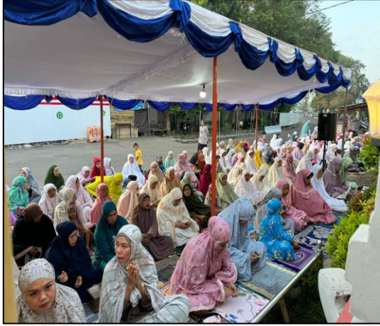
Pada hari Senin tanggal 17 Juni 2024 pukul 07.15 s.d 08.00 Wita bertempat di Masjid Baitul Muhtarifin Polres Jembrana telah dilaksanakan kegiatan Sholat Idul Adha 1445 H Tahun 2024.