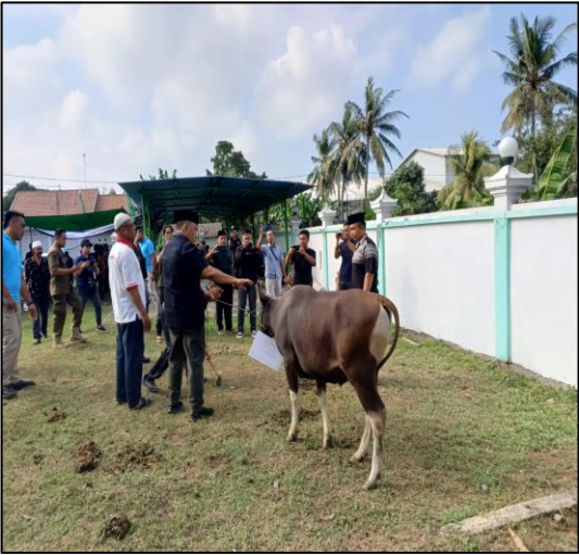
Pada hari Senin tanggal 17 Juni 2024 pukul 08.45 s.d 09.45 wita bertempat di Wilayah Kecamatan Negara Kabupaten Jembrana telah berlangsung kegiatan penyerahan bantuan hewan qurban oleh Pemkab Jembrana kepada Umat Muslim Kab.Jembrana dalam rangka Hari Raya Idul Adha 1445 H Tahun 2024.