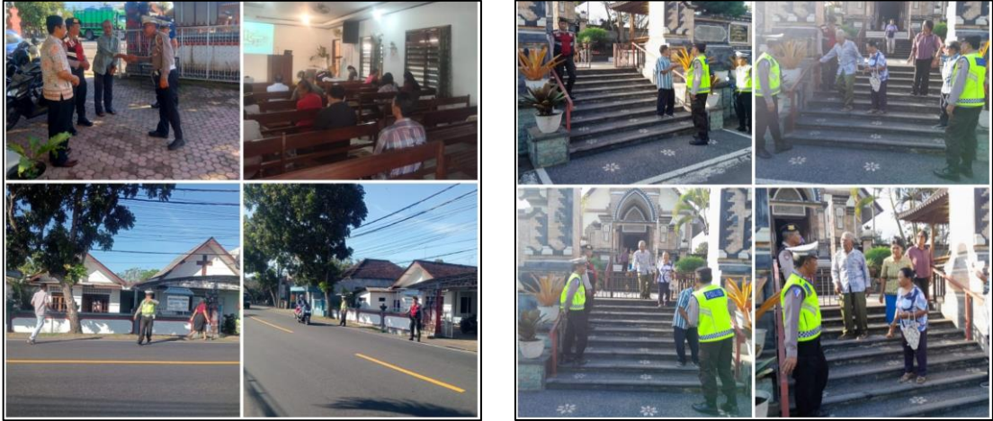
Pada hari Minggu tanggal 14 Juli 2024 bertempat dimasing-masing Gereja se-Kab. Jembrana telah dilaksanakan kegiatan Ibadah Minggu oleh Umat Nasrani