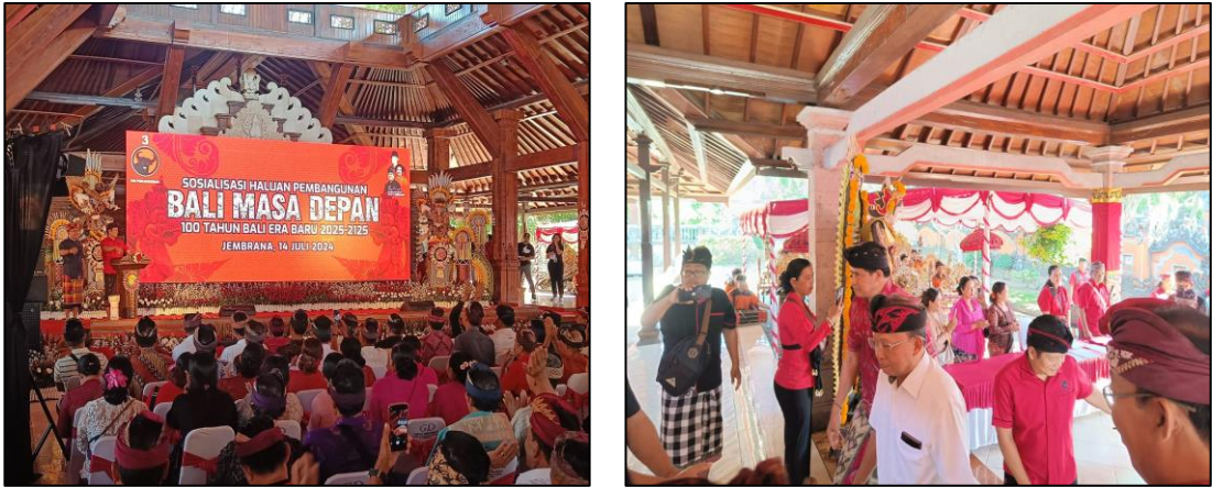
Pada hari Minggu, tanggal 14 Juli 2024 pukul 09.00 s.d 12.20 Wita, Bertempat di Gedung Pendopo Kesari Kel. Banjar Tengah, Kec. Negara, Kab. Jembrana telah dilaksanakan Kegiatan Sosialisasi Haluan Pembangunan Bali Masa Depan 100 Tahun Bali Era Baru 2025-2125 DPD PDI Perjuangan Provinsi Bali”.