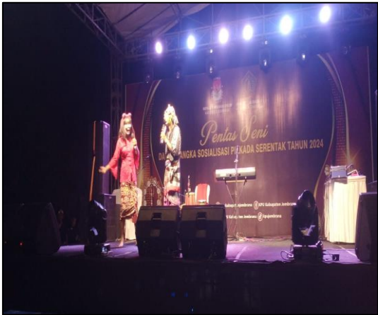
Pada hari Sabtu tanggal 20 Juli 2024 pukul 19.00 Wita bertempat di Lapangan Satria Mandala Pekutatan Jl. Denpasar-Gilimanuk Br. Pasar, Ds./Kec. Pekutatan, Kab. Jembrana, telah berlangsung kegiatan Pentas Seni Dalka Sosialisasi Pilkada Serentak Tahun 2024 yang diselenggarakan oleh KPU Kab. Jembrana.