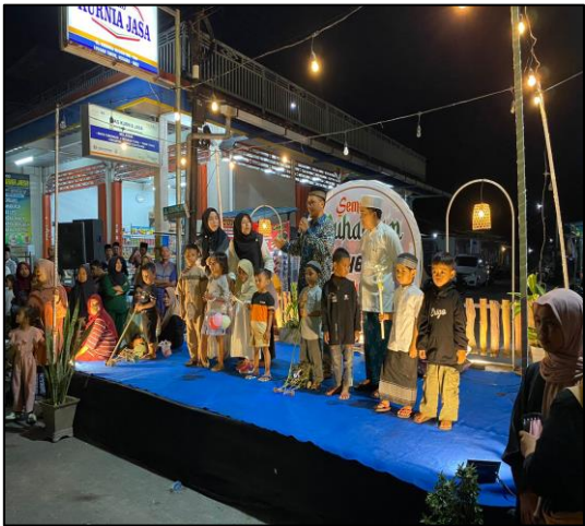
Pada hari Sabtu tanggal 20 Juli 2024 pukul 20.00 s.d 22.45 wita bertempat di Perempatan Jalan Gunung Agung Loloan Timur, Kec./Kab. Jembrana telah dilaksanakan Pawai Obor Dalam Rangka Memperingati Tahun Baru Islam 1 Muharram 1446 H Tahun 2024 Yang Diselenggarakan Oleh Remaja Loloan Timur.