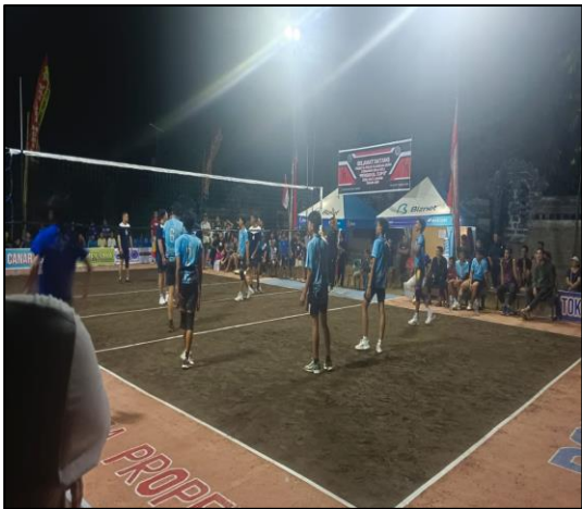
Pada hari Jumat tanggal 26 Juli 2024 mulai pukul 19.00 s.d. 22.50 Wita bertempat di Lapangan Bola Voli Porduta, Br. Tegalasih, Ds. Batuagung, Kec/Kab Jembrana telah dilaksanakan kegiatan Lanjutan Turnamen Bola Voli "Perbekel Cup II" Desa Batuagung Tahun 2024.