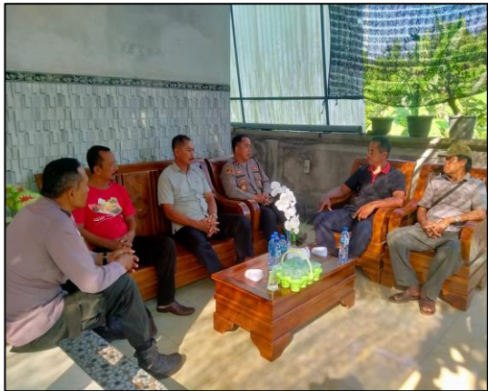
Pada hari Jumat tanggal 26 Juli 2024 pukul 09.00 s.d 09.40 wita bertempat di Kediaman Ketua Ranting Partai PDI Perjuangan Desa Baluk Br.Baluk 1 Desa Baluk Kec.Negara Kab.Jembrana telah dilaksanakan kegiatan PADL MAS Pilkada (PAtroli DIALOGIS kamtibMAS) Kapolsek Negara menjelang Pilkada Serentak Tahun 2024.