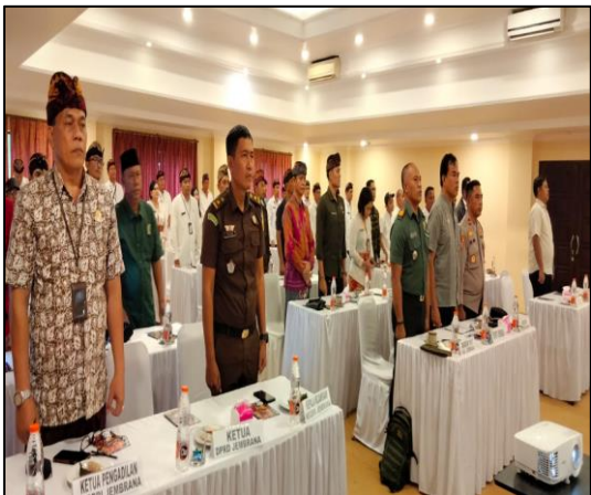
Pada hari Kamis tanggal 1 Agustus 2024, pukul 10.00 s.d 12.00 Wita bertempat di Hotel Jimbarwana, Jalan Udayana No 2, Kel. BB Agung, kec. Negara, Kab. Jembrana telah dilaksanakan kegiatan Sosialisasi Peraturan KPU Nomor 8 Tahun 2024 Tentang Pencalonan Gubernur dan Wakil Gubernur, Bupati dan Wakil Bupati, Serta Walikota dan Wakil yang diselenggarakan oleh KPU Jembrana.