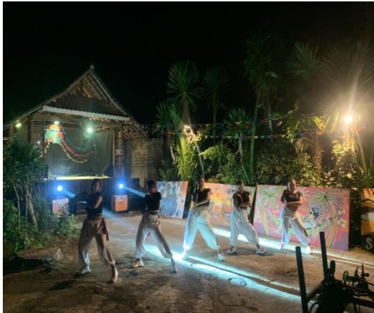
Pada hari Sabtu tanggal 3 Agustus 2024 Pukul 16.00 s.d. 22.05 Wita bertempat Home Stay Segara Urip, Ds Air Kuning, Kec.Jembrana, telah dilaksanakan Kegiatan Lukis Mural dan Festival Musik Sabtulustrasi Vol. 4 Tahun 2024.