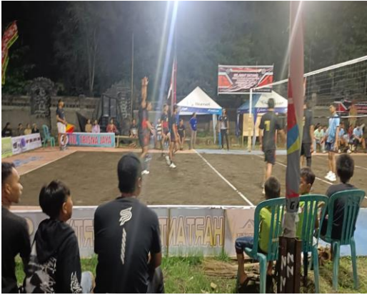
Pada hari Selasa tanggal 6 Agustus 2024 mulai pukul 20.30 s.d. 23.55 Wita bertempat di Lapangan Bola Voli Porduta, Br. Tegalasih, Ds. Batuagung, Kec/Kab Jembrana telah dilaksanakan kegiatan Lanjutan Turnamen Bola Voli "Perbekel Cup II" Desa Batuagung Tahun 2024.