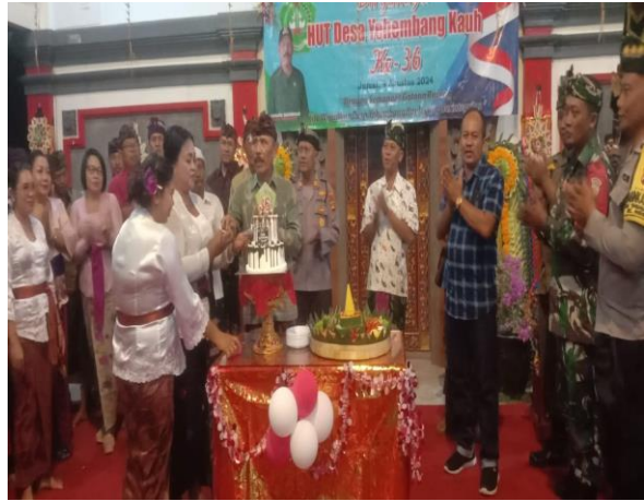
Pada hari Jumat tgl 9 Agustus 2024 pkl. 19.30 s.d 22.00 wita bertempat di stage terbuka Anjungan Cerdas Mandiri Rambut Siwi, Ds. Yehembang Kangin Kec. Mendoyo telah berlangsung malam perayaan HUT Desa Yehembang Kangin ke-36 tahun 2024.