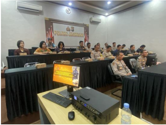
Pada hari Selasa tanggal 13 Agustus 2024 Pukul 08.30 s.d 12.15 Wita bertempat di Rumatama Polres Jembrana telah dilaksanakan kegiatan Ceramah Tentang Penanggulangan Radikalisme dan Intoleransi Serta Penyimpangan Orientasi Seksual.