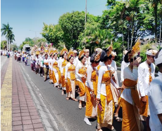
Pada hari minggu tanggal 18 Agustus 2024 pukul 10.00 Wita s/d Selesai bertempat di Pura Jagatnatha, Kel. Dauharu, kec/Kab. Jembrana telah dilaksanakan kegiatan Karya Pujawali Pura Jagatnatha.