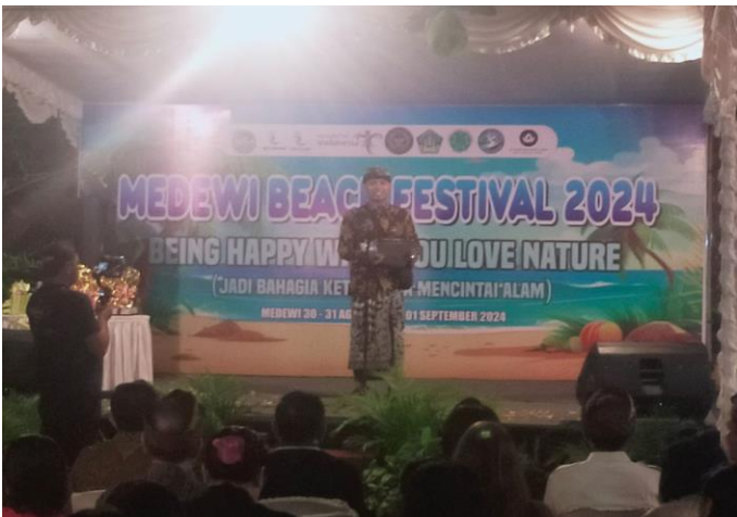
Pada hari Jumat tanggal 30 Agustus 2024 pukul 19.15 Wita, telah berlangsung giat Medewi Beach Festival Tahun 2024 dg tema BEING HAPPY WHEN YOU LOVE NATURE - Jadi Bahagia Ketika Kita Mencintai Alam bertempat di Pantai Medewi Dusun Persinggahan Desa Medewi Kec. Pekutatan Kab. Jembrana.