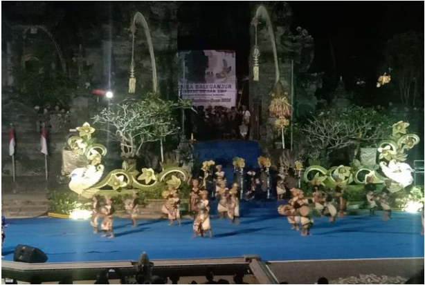
Pada hari Jumat tanggal 30 Agustus 2024 pukul 19.15 s.d 21.40 wita bertempat di Arda Candra Pura Jagatnatha Kab. Jembrana telah dilaksanakan Kegiatan Lomba Bleganjur Tingkat SD dan SMP se-Kab. Jembrana Dalam Rangka Memperingati HUT Kota Negara ke-129 dan HUT RI ke-79