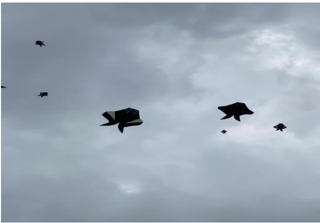
Pada hari Minggu tanggal 8 September 2024, pukul 09.00 s.d 16.00 wita bertempat di Grand Hill Munduk Nangka , Dsn. Tangin Meyeh, Desa.Berambang, Kec.Negara, Kab.Jembrana, berlangsung Giat Lomba Layang layang ""Sunarent Cotek Blolong Pestiva " dengan tema : Menjaga kelestarian Adat Seni Budaya Bali.