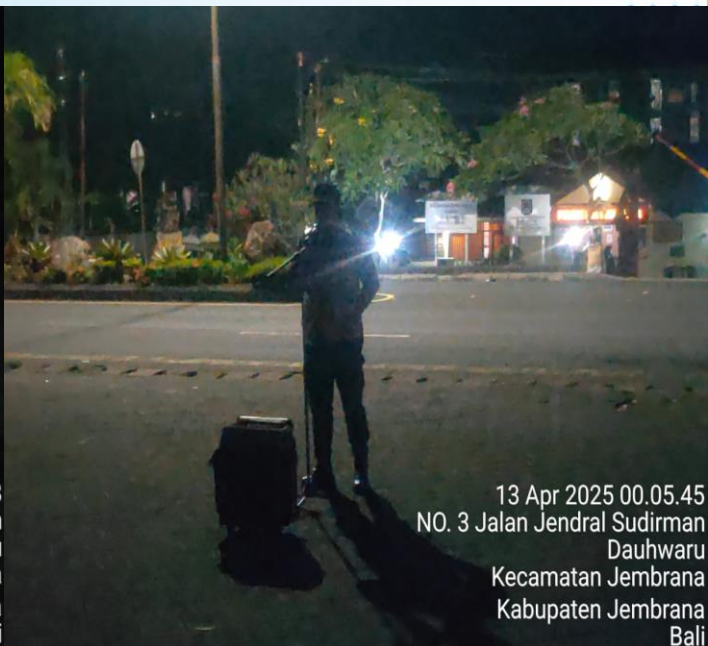
13 Apr 2025 00.05.45 NO. 3 Jalan Jendral Sudirman Dauhwaru Kecamatan Jembrana Kabupaten Jembrana Bali