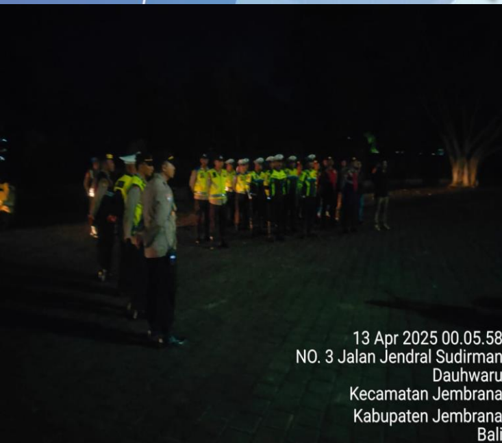
13 Apr 2025 00.05.58 NO. 3 Jalan Jendral Sudirman Dauhwaru Kecamatan Jembrana Kabupaten Jembrana Bali