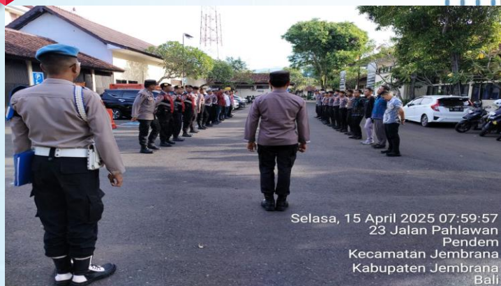
Selasa, 15 April 2025 07:59:57 23 Jalan Pahlawan Pendem Kecamatan Jemberana Kabupaten Jemberana Bali