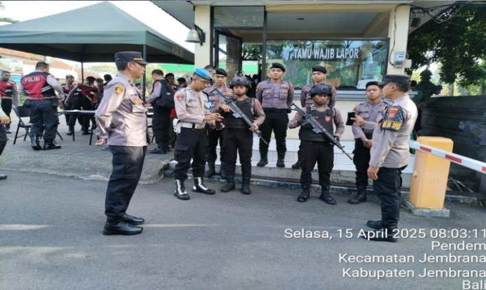
Selasa, 15 April 2025 08:03:11 Pendem Kecamatan Jemberana Kabupaten Jemberana Bali