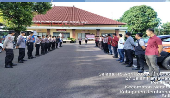
Selasa, 15 April 2025 08:00:36 27 Jalan Pahlawan Pendem Kecamatan Negara Kabupaten Jemberana Bali